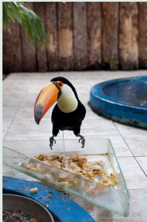
WOLFGANG TILLMANS, TUKANI, 2010

Pierwsza w Polsce indywidualna wystawa prac światowej sławy fotografa Wolfganga Tillmansa, przygotowana przez Kunstsammlung Nordrhein-Westfalen w Düsseldorfie we współpracy z Zachętą Narodową Galerią Sztuki. W Zachęcie Wolfgang Tillmans prezentuje kompozycje prac stworzoną specjalnie dla sal galerii i ukazujących tematy oraz motywy fotograficzne zajmujące go w ciągu ostatnich dziesięciu lat. Znalazły się tu abstrakcyjne fotografie z serii kropli z papieru i Freischwimmer, jak i wybór najnowszych prac — „obrazów świata”. Pokazane jest również pięć prac wideo artysty oraz Centrum studiów prawdy — instalacje na stołach, które na podobieństwo archiwum dokumentacyjnego łączą fotografie z wycinkami prasowymi, fotokopiami, drukami offsetowymi i ulotkami.