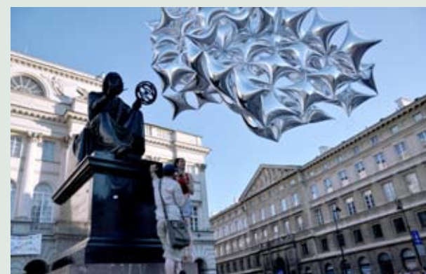
CENTRALA, PROJEKT LATAJĄCY DACH PLENEROWY / THE PROJECT FLYING OPEN-AIR ROOF, 2010

curator of Kordegarda Project: Magda Kardasz cooperation: Adam Repucha