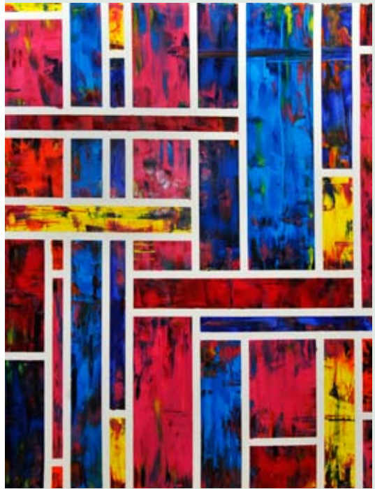
for: dziełki uprzedmiści / photo courtesy of Galeria WSA

ul. Żelazna 54/5, tel. / phone +48 602 663 090; www.galeriawsa.com pon. – sob. / Mon. – Sat. 12–20 Galeria WSA współpracuje z Wyższą Szkołą Artystyczną w Warszawie / Galeria WSA is affiliated with Warsaw School of Art