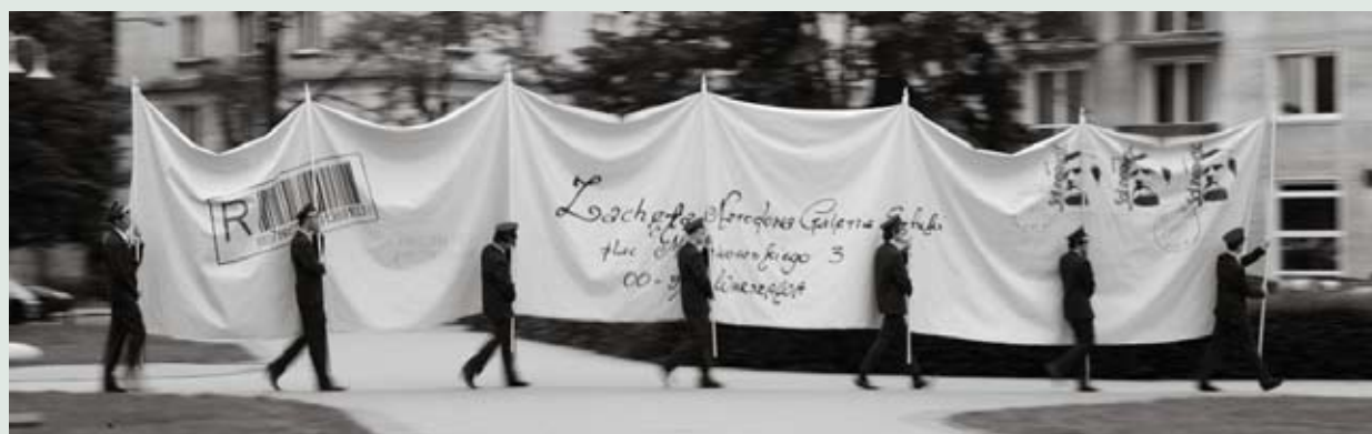
GOSHA MACUGA, LIST / THE LETTER, 2011, GOBELIN / TAPESTRY